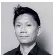
THE PHAT CUN