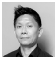
THE PHAT CUN